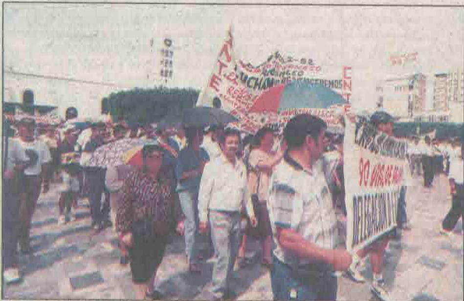
Profesores de la Sección 7a. concluyeron ayer una jornada de 72 horas de lucha. • 9