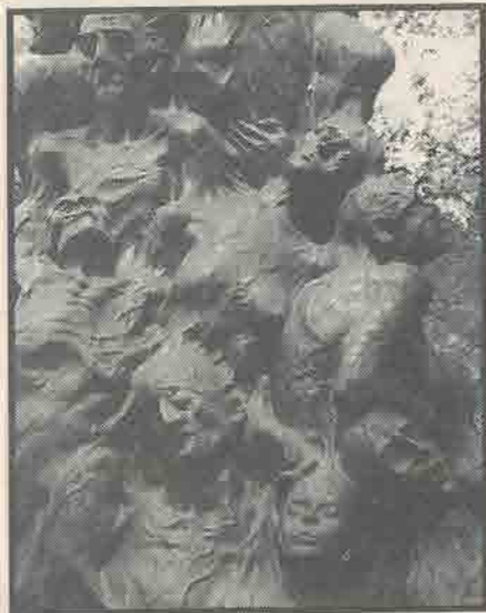
La escultura del artista danés Jens Galschiot que se encuentra en Acteal.

El artista montó en Acteal su obra 'La columna de la infamia', recordatorio de la masacre de 45 tzotziles en ese poblado, en 1997