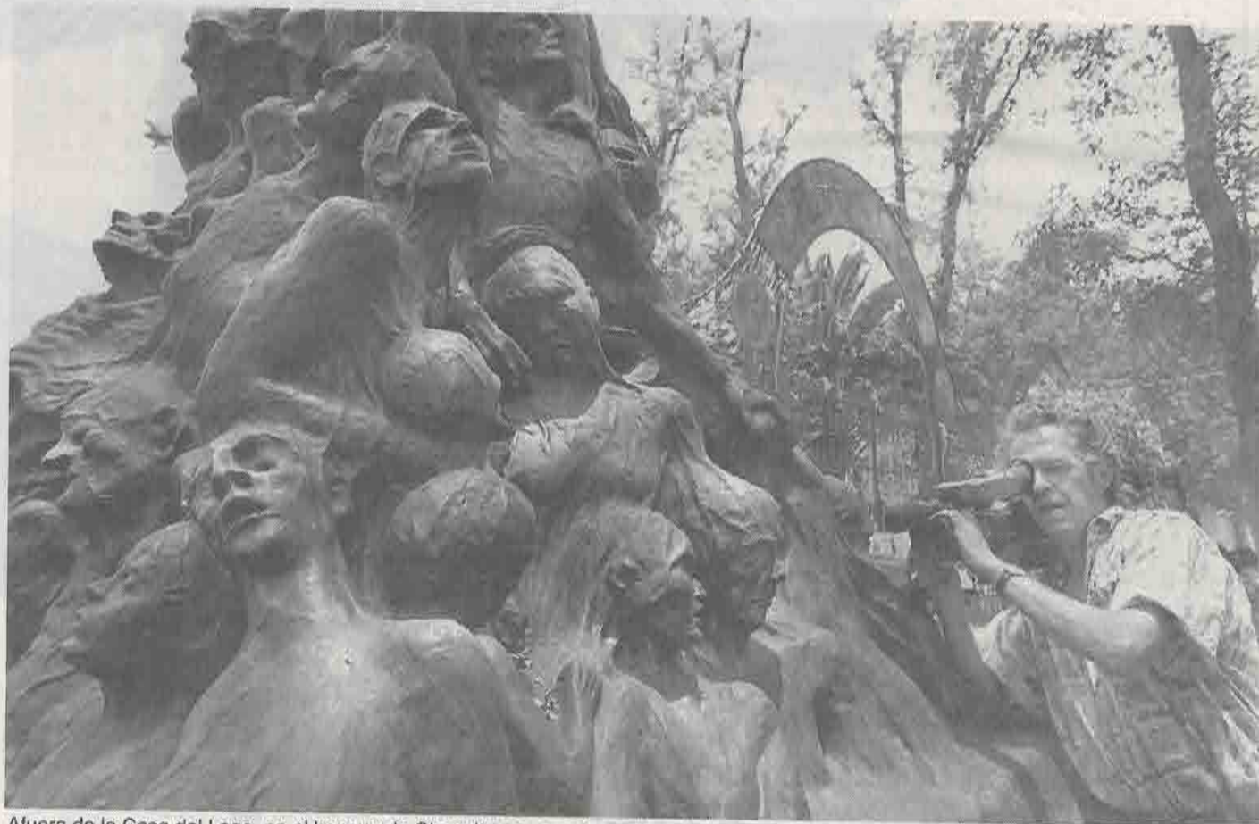
Afuera de la Casa del Lago, en el bosque de Chapultepec, ayer fue colocada la escultura Columna de la infamia , del danés Jens Galschiot, para conmemorar 16 meses de la masacre de indígenas en Chiapas. Mientras, en ese estado, el comandante David, de la dirección del EZLN, declaró que el gobierno quiere borrar para siempre los acuerdos de San Andrés Larráinzar y por eso "los tiró a la basura"