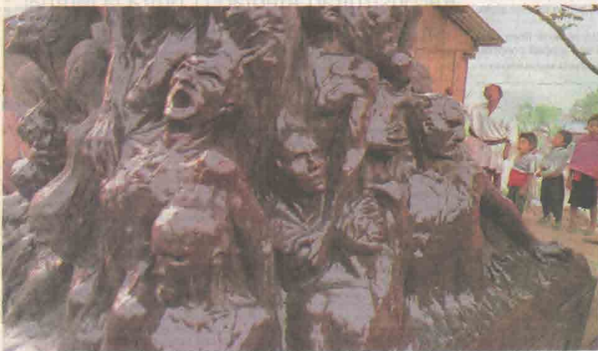
LA COLUMNA de la Ignominia, una escultura de bronce de casi ocho metros de altura del artista holandés Jens Galschiot que ha recorrido el mundo donde se han cometido afrentas contra la humanidad, llegó ayer a la localidad chiapaneca de Acteal para recordar la matanza ocurrida ahí en diciembre de 1997