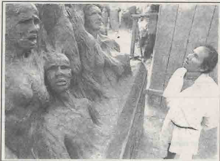
Un grupo de artistas europeos instaló una escultura denominada La columna de la infamia en la comunidad mexicana de Acteal.