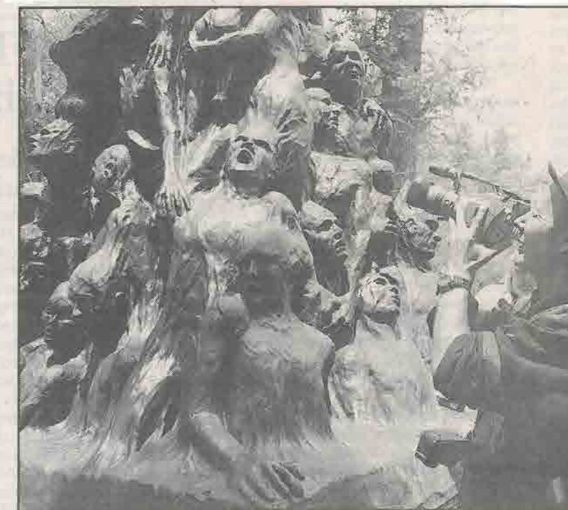
La Columna de la Infamia , obra del escultor danés Jens Galschiot que ha sido expuesta en varios países fue colocada ayer en el pórtico de la Casa del Lago del Bosque de Chapultepec. Esta vez se dedica a la infamia de haber destruido el gobierno teatro de más de mil localidades en ese sitio.