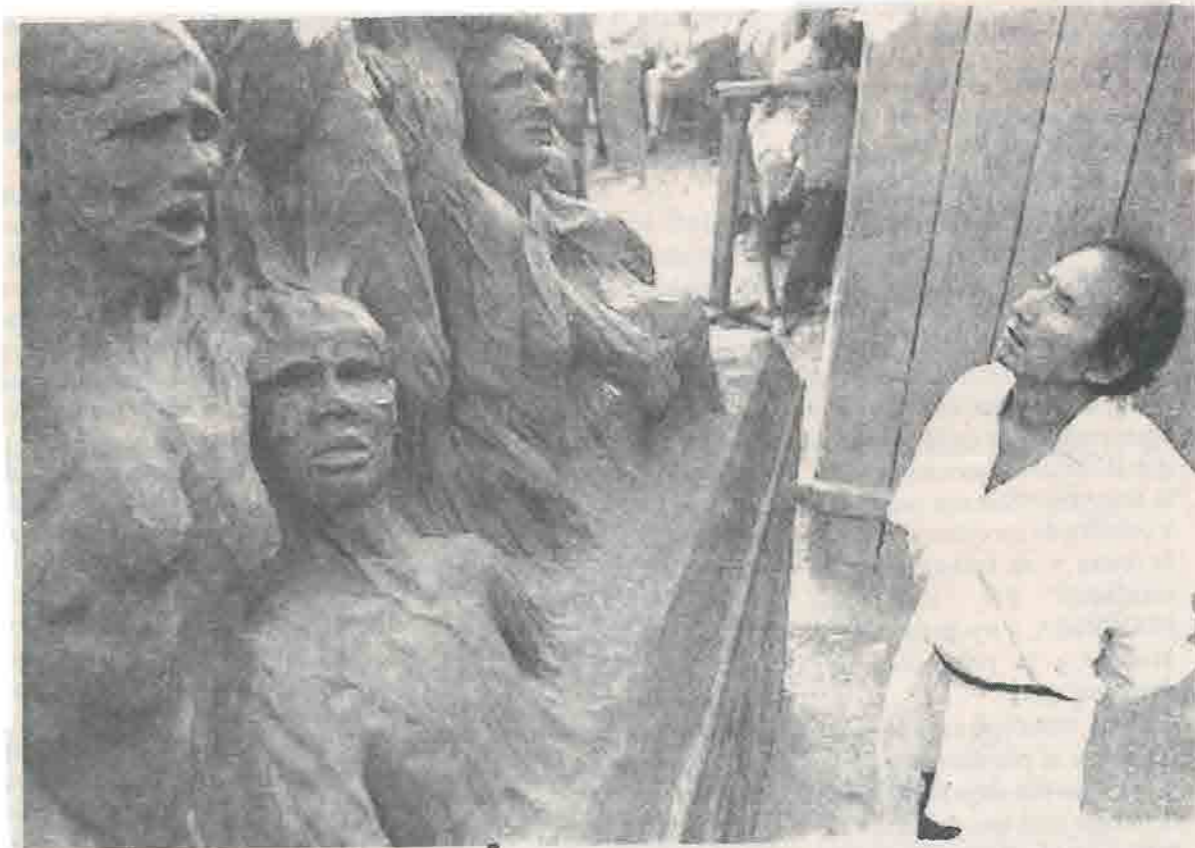
Un grupo de artistas europeos instaló una escultura denominada La columna de la infamia en la comunidad mexicana de Acteal.