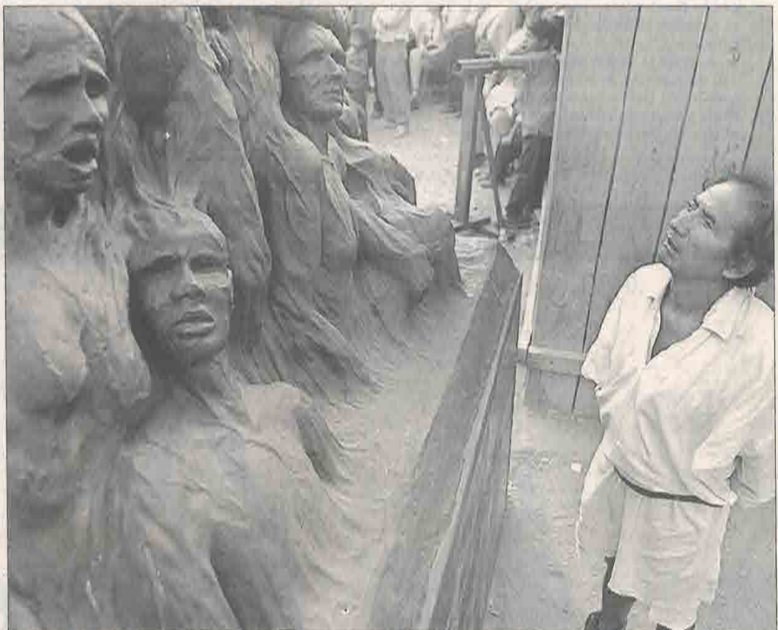
Un indígena de Acteal contempla el grupo escultórico que recuerda la matanza de 1997.

Más de 40 artistas europeos colocaron la figura con la ayuda de indígenas toztziles que sobrevivieron a la matanza. El portavoz de los indígenas recordó que la masacre trató de impedir a los indios que prosiguieran con su "lucha pacífica por la justicia, la libertad y la democracia".