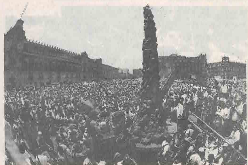
El SME a su paso por Madero. En el Zócalo, instalación pasajera de la Columna de la Infamia, en memoria a los muertos de Acteal