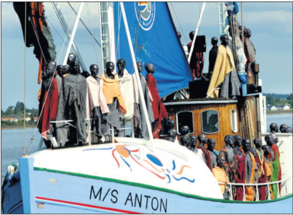
Den stjålne skulptur var en af de 70 »flygtninge«, som ankom til Holbæk den 27. august.