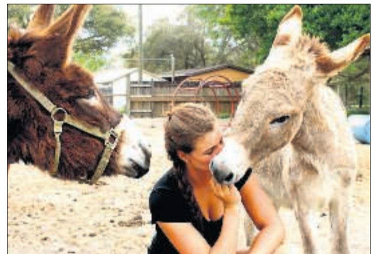
Alle dyr skal behandles ordentligt.