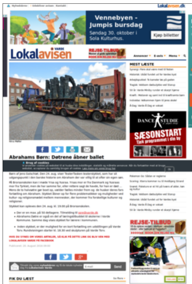
Abrahams Døtre på Brorsonskolen GoVarde - 20.08.2016 06:14

Abrahams Børn: Døtrene åbner ballet NYT OM Sydjylland - 20.08.2016 09:25