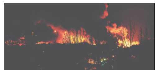
Branden på Fredericia Havn 3. februar i år - her set fra ottende et af hushusene på Jernbanegade. Over 300 mand fra Trekantens idrætsforening kæmpede flere dage sammen med andre flere kolleger fra andre brandvæsen og andre dele af beredskabet mod flammene. Nu kan man se dem på Trekantens idrætsforening i en international konkurrence om hæder for vedvarende hjælp.

Såfremt der kan skaffes flertal for økonomisk støtte, vil Galschiøts installation blive opstillet i Vejle i slutningen af august næste år og taget ned igen i starten af november.