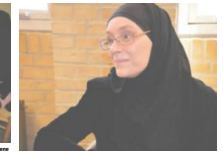
Menneskebiblioteket var åbnet for København.