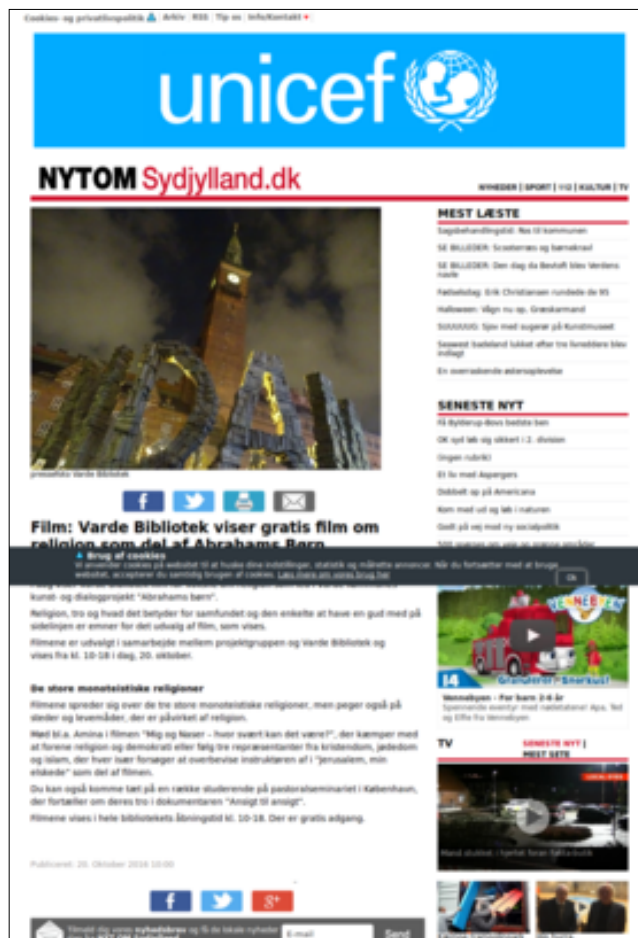
Lokalavisen Budstikken Varde - 20.10.2016 10:20

Film: Varde Bibliotek viser gratis film om religion som del af Abrahams Børn