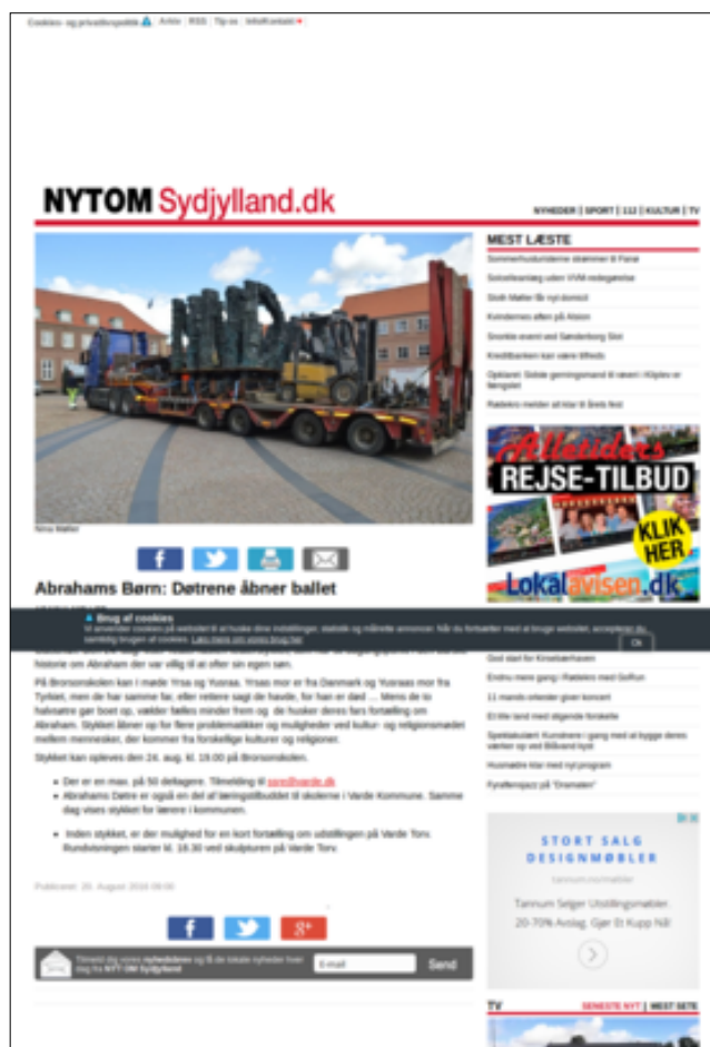
Abrahams Døtre på Brorsonskolen GoVarde - 20.08.2016 06:14