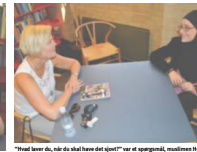
Menneskebiblioteket var åbnet for København.