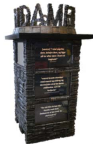
Skriftsøjlen viser de 600 citater.

Fra d. 19 april til 8 maj udstilles de følgende steder: Kantinen i Politikens hus - RUCs bibliotek - Københavns Domkirke - Ørestad Gymnasium - Albertslunds Rådhus - Vartorv i København - Silkeborg Business College - Galleri Galschiøt - TV2 Kvægtorvet.