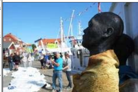
60 af Galschiøts flygtninge-skulpturer i kirker over hele København indtil 5 maj hvor de udstilles samlet på Rådhuspladsen.

Fra d. 19 april til 8 maj udstilles de følgende steder: Kantinen i Politikens hus - RUCs bibliotek - Københavns Domkirke - Ørestad Gymnasium - Albertslunds Rådhus - Vartorv i København - Silkeborg Business College - Galleri Galschiøt - TV2 Kvægtorvet.