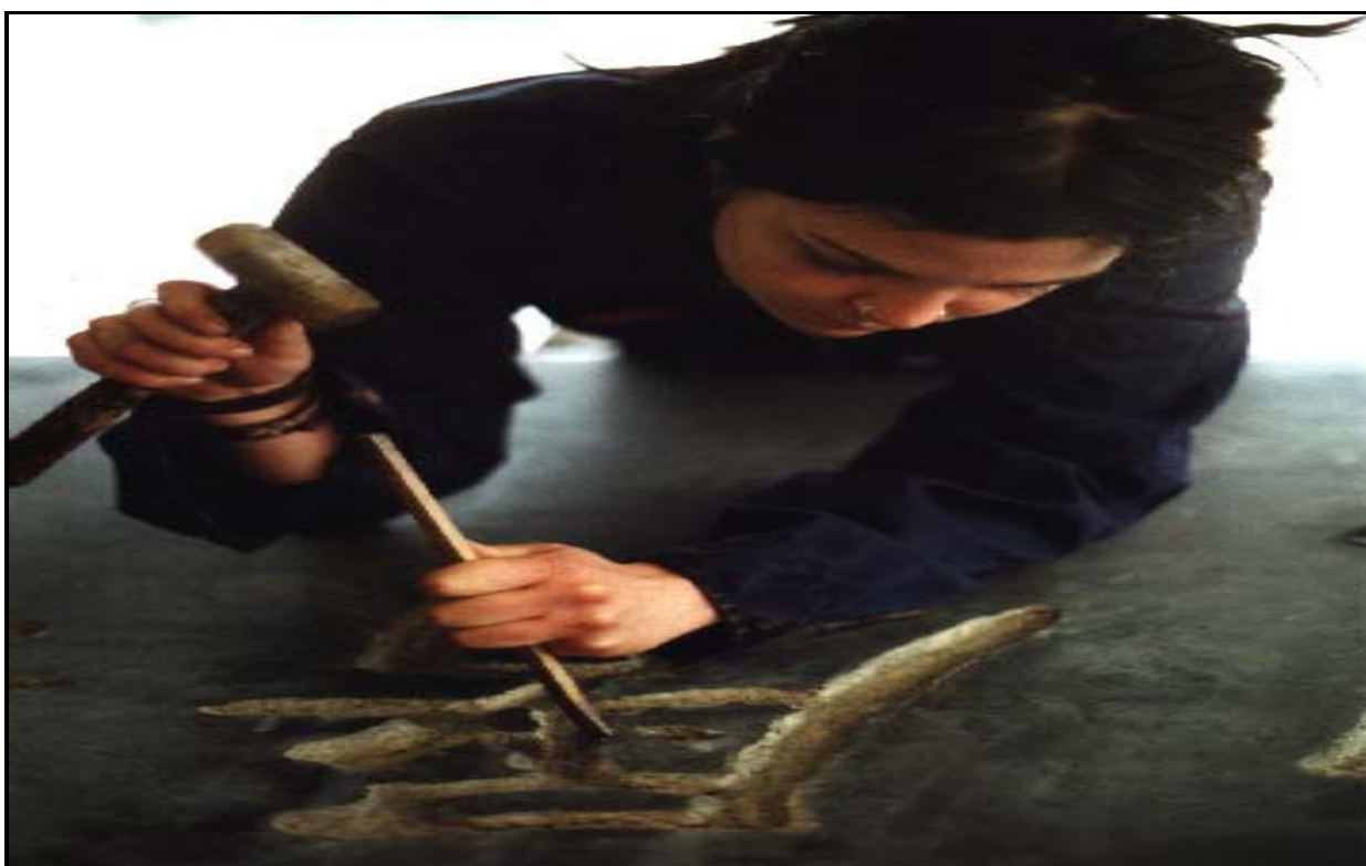
The Chinese sight for "The old cannot kill the young forever" chiseled into the socket on the memorial.