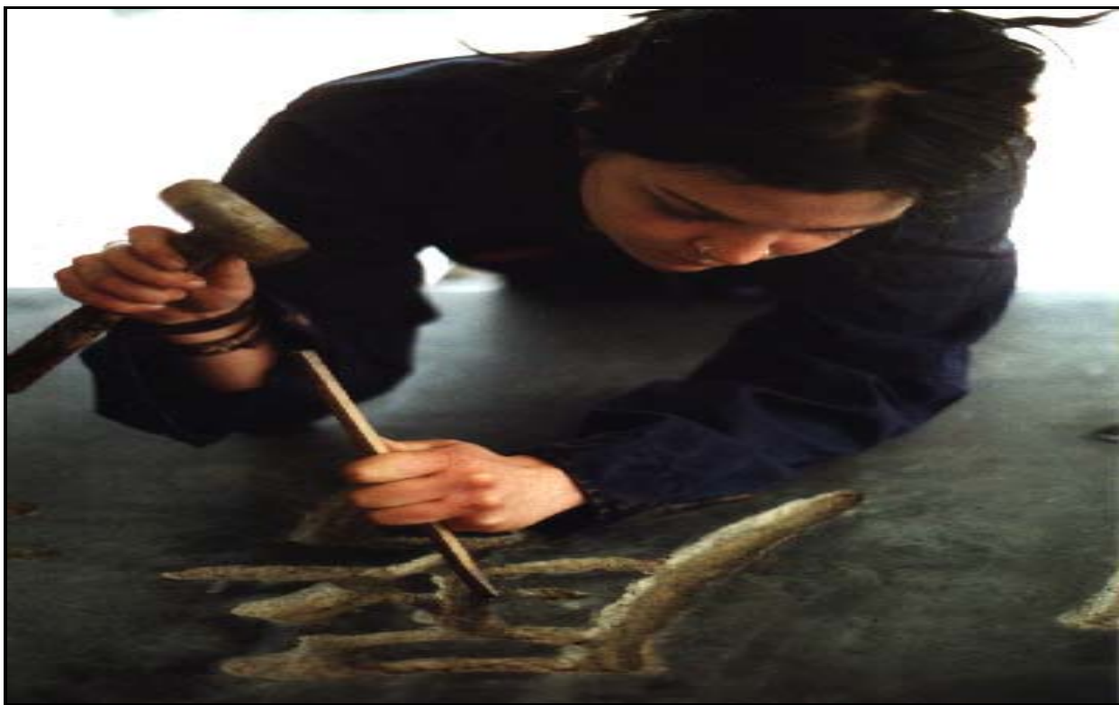
Det kinesiske tegn for "The old cannot kill the young forever" mejsles ind i mindemærkets sokel.

Unsubscribe / Change Profile *** Forward this email to a friend *** Click here to view this email in your browser