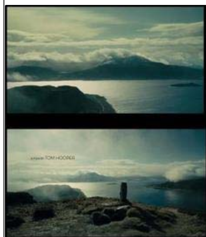
Scener fra filmen "The Danish Girl"