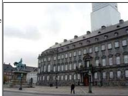
Den 15 april foran folketinget