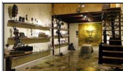
Butikken på Galleri galschiøt