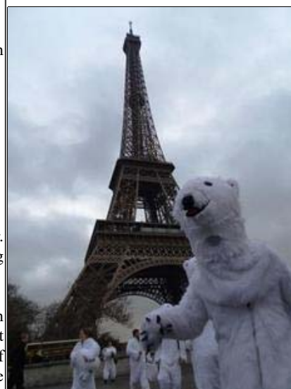
Isbjørnehæren foran Eiffeltårnet