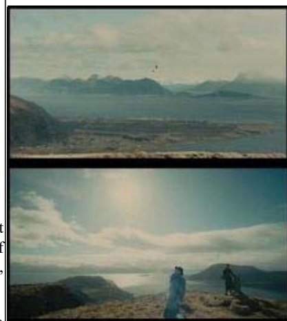
Scener fra filmen "The Danish Girl"