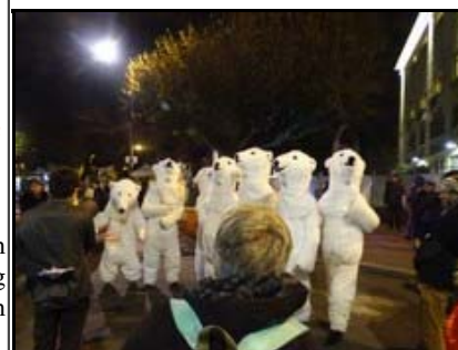
Isbjørnehæren (her i Paris under COP21) rejser til New York for at redde klimaet