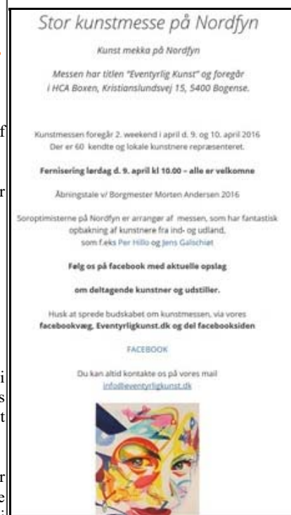
'Eventyrlig kunst' på Nordfyn