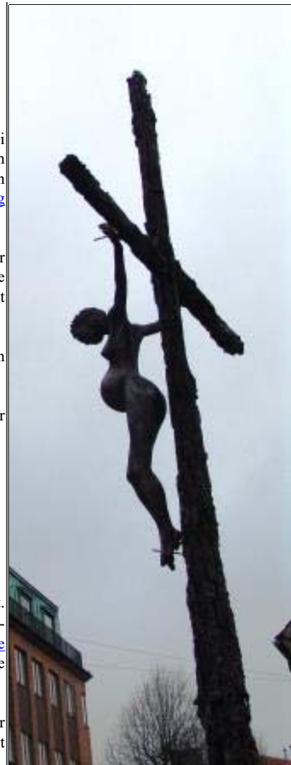
I guds navn