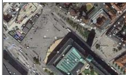
Fundamentalism udstilles ved Rådhuspladsen fra 27 april!