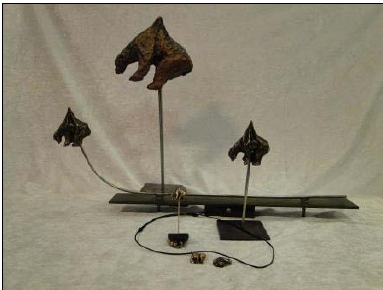
En samling af de skulpturer som vi har lavet til Crowdfunding som støtte til Unbearable (den spiddede isbjørn) i Paris: