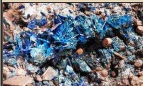
I bunden af syrekaret fandt vi flotte krystalformationer på kobberet.