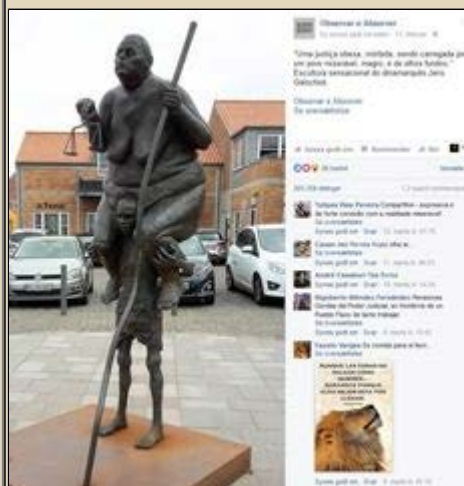
På den Brasilianske facebookside bliver skulpturen beskrevet sådan her "En overvægtig morbid retfærdighed, der transporteres af et elendigt menneske/folk med tynde, og indsunke øjne."