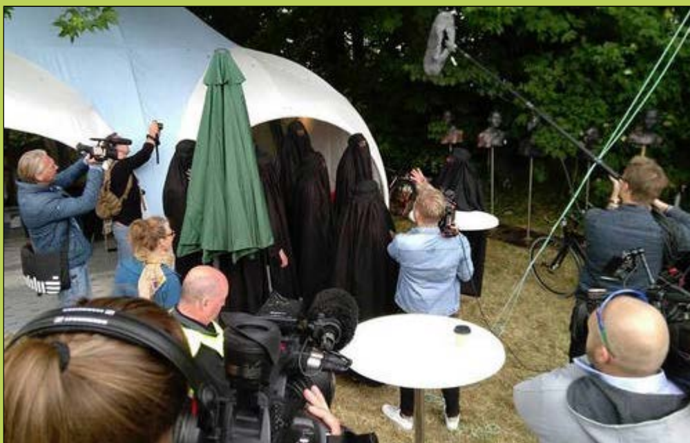
Stort set alle Danmarks aviser samt radio og tv-stationer valgte at fortælle om burka-happeningen . Billedet ovenfor er fra Magasinet Kunst