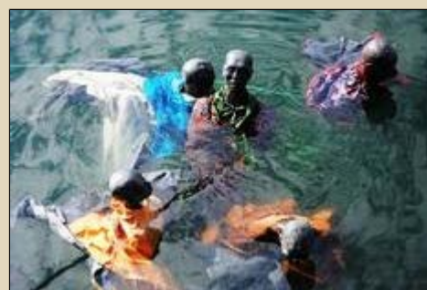
'Drowning' Refugees (Sculptures)