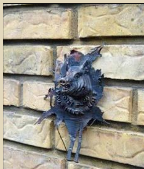
Thousands of Inner Beasts will be handed out and put in public spaces. They will remind us to be aware of our 'Inner beasts' and treat the fellow humans right.