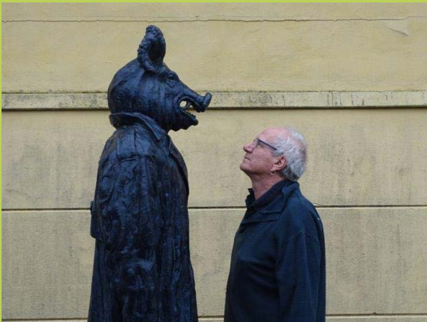
"Den indre svinehund – (ham til venstre) havde 25 års jubilæum i nov 2018 . Det var hans første kunststapning og blev startsskudet til en ændring af al hans kunst fremover