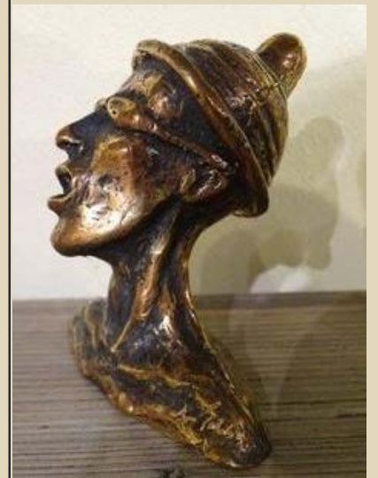
"Orgasme piloten" Bronze ,