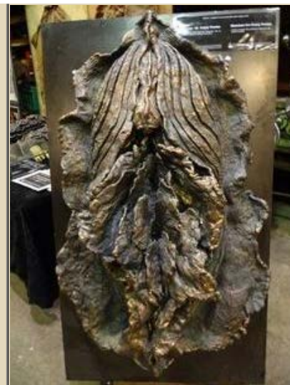
"Pussy poems" unik kobber, 130x70x25 cm.