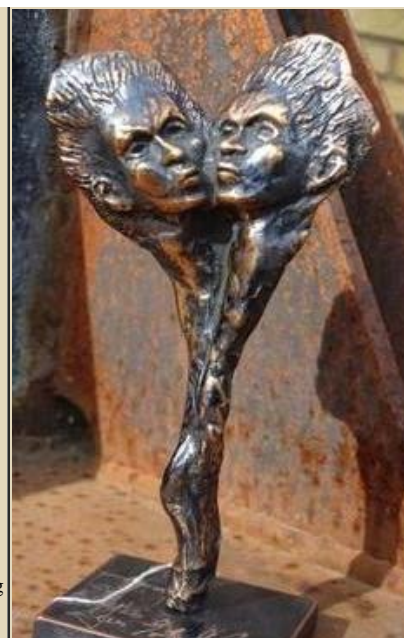
"Og størst er kærligheden" 16x8x8 cm i bronze,

24. marts Isbjørne i Favrskov : Udstilling til Årets klimauge i Favrskov lånte Galschiøts isbjørnedragter til events og udstilling.