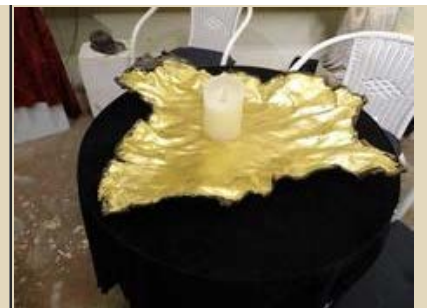
"Fad" Unik, kobber belagt med 24 karat bladguld,60x60x8