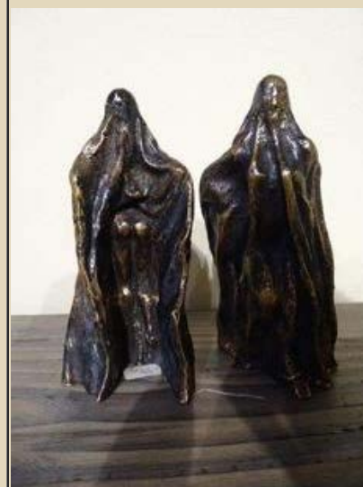
"burka pige-fra burkahappeing ) , bronzen 18x10x10 cm