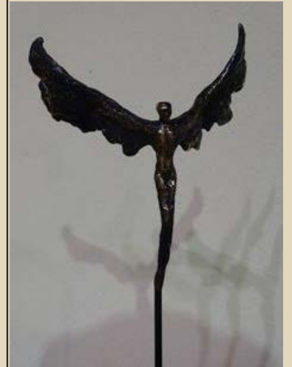
"Skytengel Gabriel", 18x10x8 cmbronz .