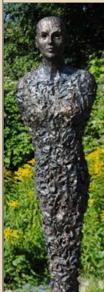
"Homo Sapiens" unik,