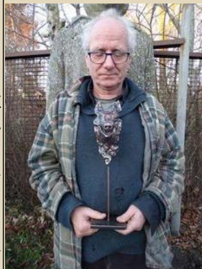
"Den indre svinehund - jubileums skulptur"