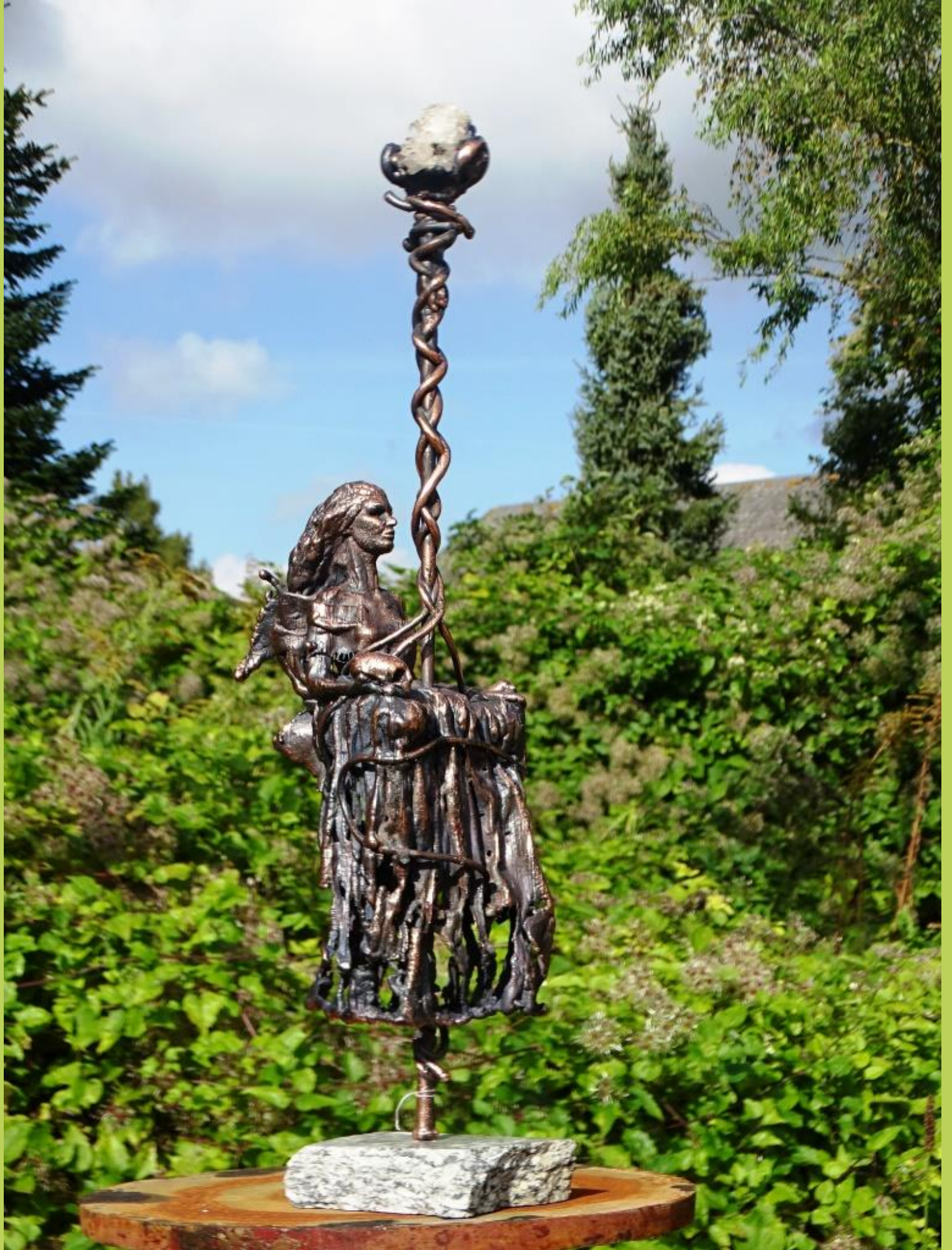
Foto: Magikeren - en af skulpturerne fra solcelle serien.