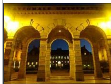
Cité internationale universitaire de Paris