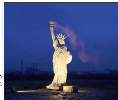
Freedom To Pollute, 6 meter høj Frihedsgudinde.