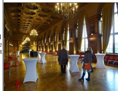
Ferniseringen afholdes i det fine Maison internationale.

Vi medbringer Unbearable-isbjørnen på toppen af en bil, fulgt af Freedom To Pollute –skulpturen og et optog med en masse mindre, men klimarelevante, skulpturer. 10 af vores aktivister vil være ikledt isbjørne-dragter og der vil være fed klezmer-musik at danse sig varm til.