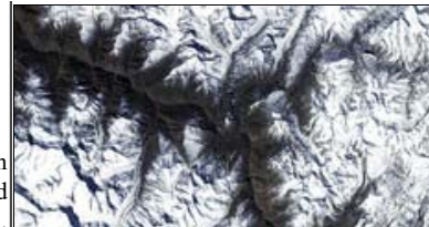
Billede fra UNESCO-udstillingen.

E-mail: aidoh@aidoh.dk , Internet: www.aidoh.dk , tel. +45 6618 4058, mobil +45 4044 7058 Banevænget 22, DK-5270 Odense Denmark