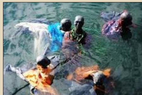
'Drowning' Refugees (Sculptures)