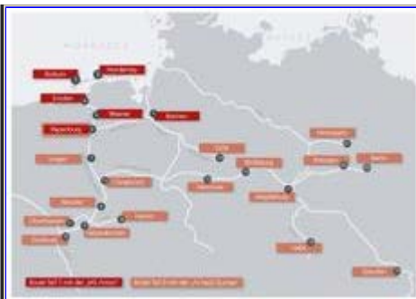
The Refugee Ships will visit 24 harbours in Germany this summer. See sail plan

De etablerede kunstnere må tage et medansvar for verdens udvikling. De må forbinde sig til NGOer, aktivister og videnskabsfolk. Se