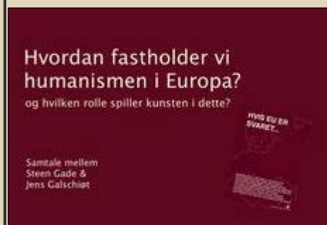
Debatmøde med Steen Gade