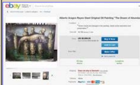
Ebay sælger ud af stjålne malerier