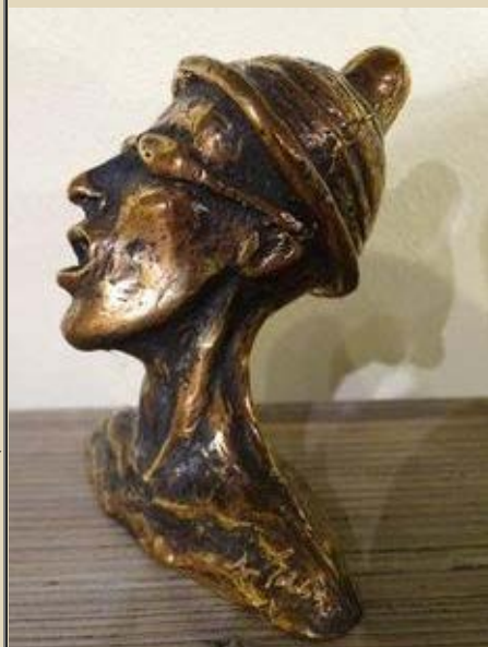
"Orgasme piloten" Bronze ,