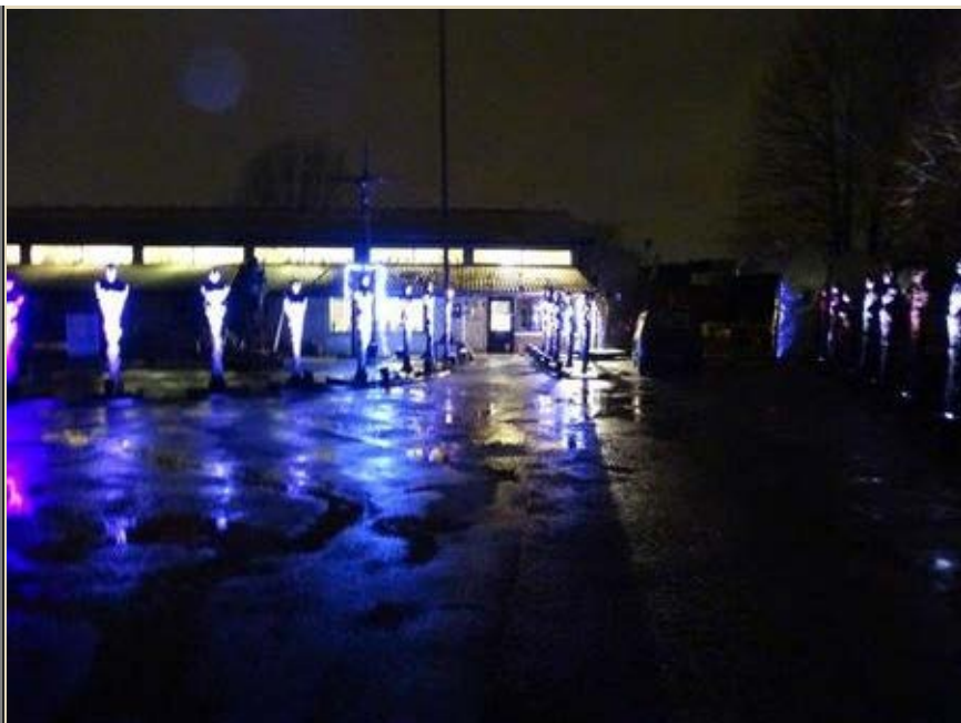
Homo Sapiens skulpturer med lys installation blev opstillet på sidste års kulturmøde på Mors 2018