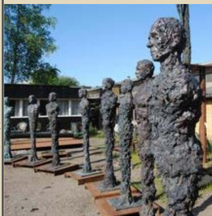
"Homo Sapiens serien" alle 21 skulpturer med lysætning