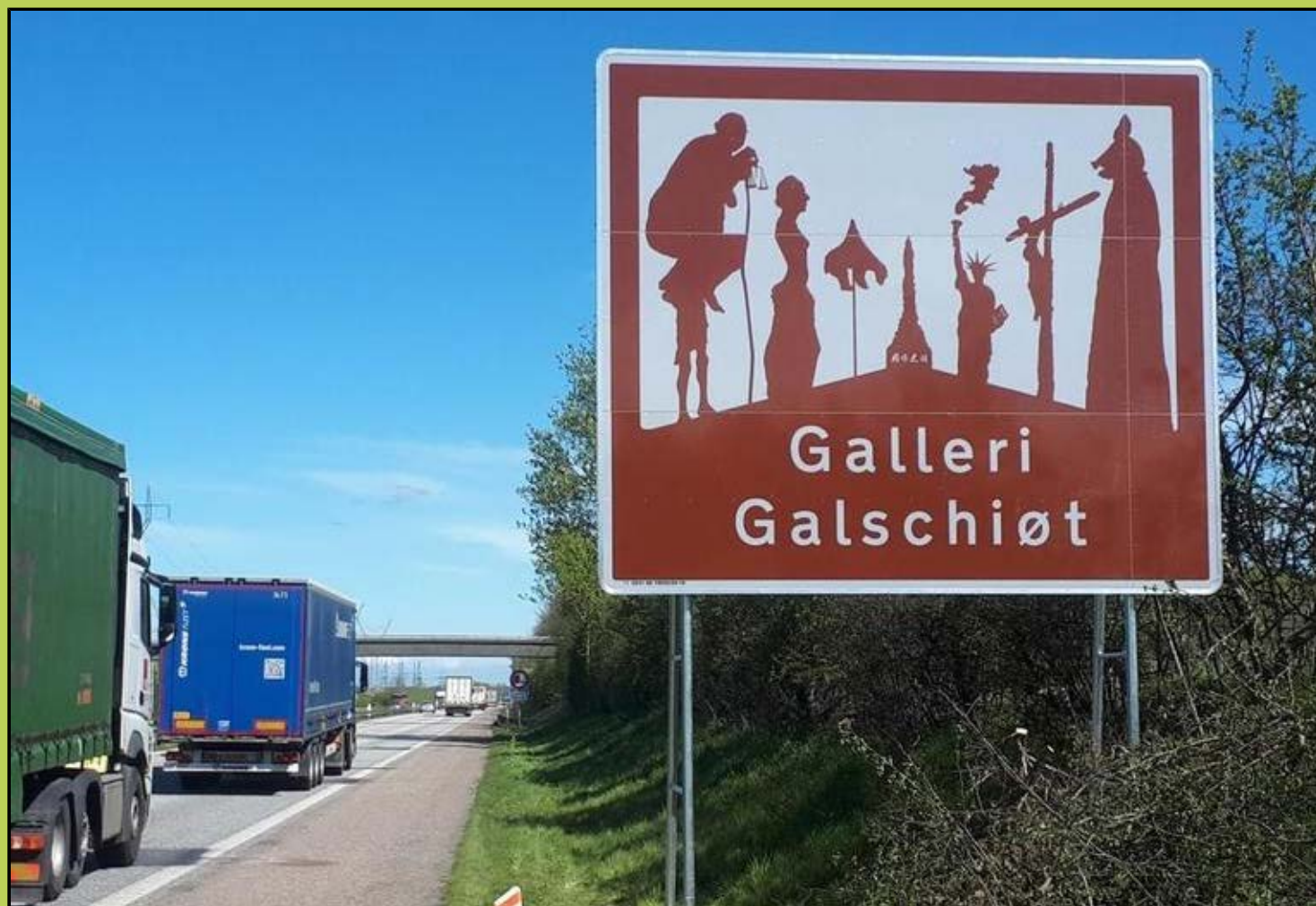
iltet med de 7 skulpture